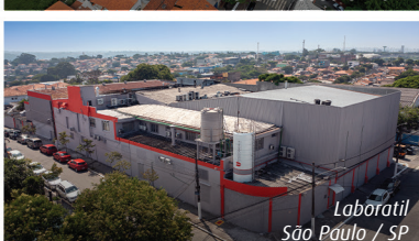
Laboratil São Paulo / SP