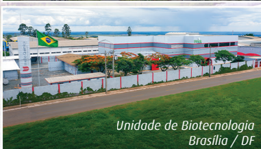
Unidade de Biotecnologia Brasília / DF