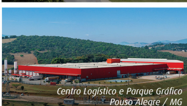
Centro Logístico e Parque Gráfico Pouso Alegre / MG