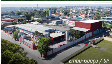
Embu-Guaçu / SP