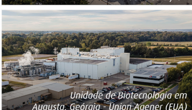
Unidade de Biotecnologia em Augusta, Geórgia - União Agener (EUA)