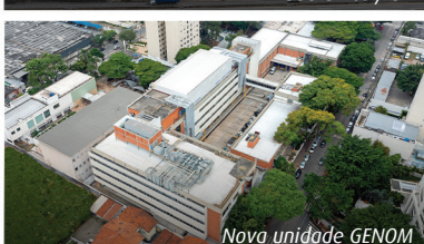
Nova unidade GENOM