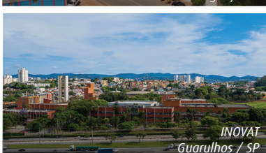
INOVAT Guarulhos / SP