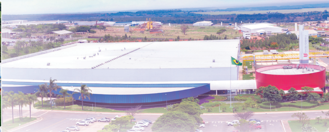
Polo Industrial JK Brasília / DF