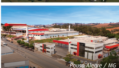
Pouso Alegre / MG