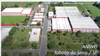
ANOVIS Taboão da Serra / SP